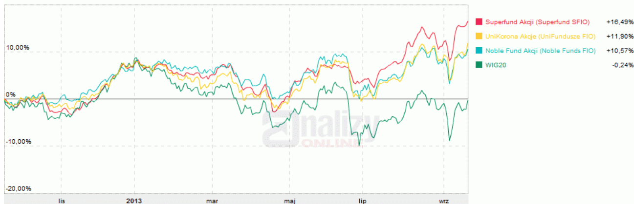
Wykres wyników 4 instrumentów finansowych (Superfund Akcji, UniKorona Akcje, Noble Fund Akcji, WIG20). Źródło: Analizy Online, okres: 19.09.2012 – 19.09.2013

Fundusz jest doskonałym remedium w czasie spadków na rynkach akcji . Na kolejnym wykresie zestawione są: fundusz Superfund Akcji, indeks WIG20 oraz 2 popularne, konkurencyjne fundusze akcyjne. Jak widać, dywersyfikacja w obrębie funduszu Superfund Akcji, plasuje go dużo wyżej niż WIG20 i w większości wyżej niż inne fundusze akcyjne z rynku polskiego.