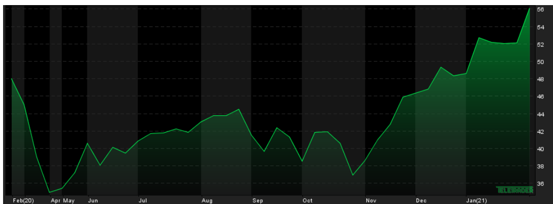
Notowania cen ropy WTI, 1Y, źródło: Teletreader.com

Największym wsparciem dla notowań ropy w ostatnich dniach są działania państw OPEC+. Producenci ropy naftowej w tzw. rozszerzonym kartelu OPEC zdecydowali o przedłużeniu cięć produkcji ropy naftowej w lutym i w marcu,