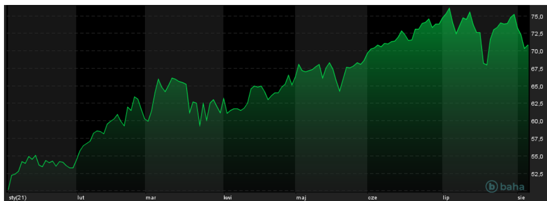
Notowania cen ropy Brent, YTD, źródło: baha.com

Dynamiczne przeceny ropy naftowej jakie obserwowaliśmy w bieżącym tygodniu to głównie efekt tego, co dzieje się w Azji. Sytuacja pandemiczna na tym kontynencie jest coraz trudniejsza, a o rozprzestrzenianiu się koronawirusa w wariantcie Delta na nowe prowincje poinformowały m.in. Chiny. Kraj ten jest jednym z największych konsumentów ropy naftowej na świecie, po Stanach Zjednoczonych, więc wizja powrotu tamtejszych restrykcji wyraźnie przekłada się na obawy dotyczące popytu na ropę naftową.