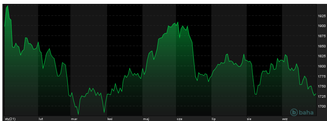
Notowania cen złota, YTD, źródło: baha.com

Na rynkach metali szlachetnych nieustannie siłę pokazuje strona podażowa. Wszystko za sprawą niesprzyjających kruszcom informacji związanych z amerykańską polityką monetarną. We wtorek notowania kontraktów na złoto pogłębiły spadki, schodząc do okolic 1720-1730 USD za uncję. Silne tąpnięcie można było obserwować na rynku srebra, którego cena zniżkowała do rejonu 21,50 USD za uncję. Oba metale pozostają blisko wtorkowych minimów cenowych także w środę.