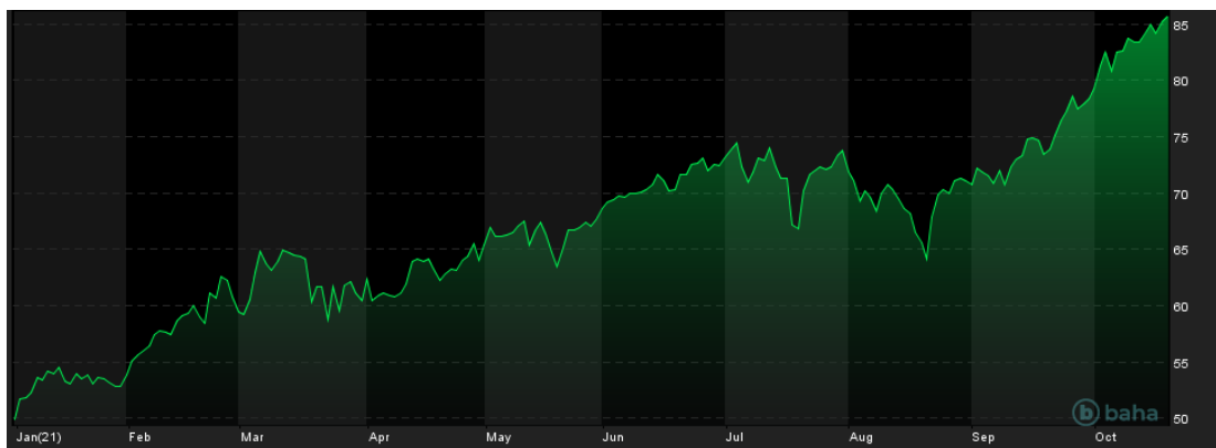
Brent crude oil, YTD, baha.com

Dodatkowo OPEC+ zaznaczyło, że wydobycie ropy we wrześniu bieżącego roku wynosiło 115% zakładanego planu, co jest spadkiem o 1 punkt procentowy w porównaniu z sierpniem. Producenci robią wszystko, żeby wykorzystać najwyższą cenę ropy od 7 lat.