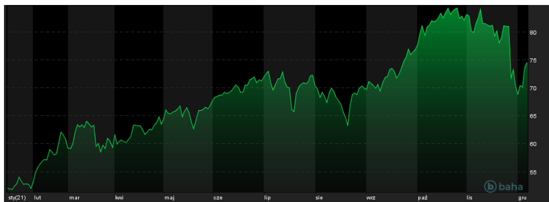
Notowania cen ropy Brent, YTD

Pojawienie się wariantu koronawirusa Omikron wywołało głębokie przeceny na rynkach wielu surowców. Obecnie trwają próby stabilizacji notowań oraz nadrobienia części wcześniejszych zniżek. Tak jest na rynku ropy naftowej oraz na rynkach wielu metali.