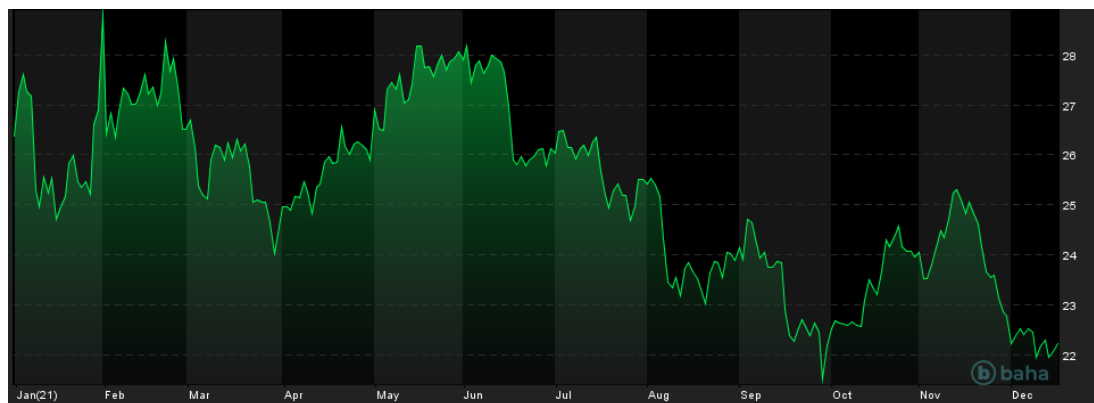
Notowania cen srebra, YTD

Ze względu na brak zaskoczenia ze strony Fed, notowania amerykańskiego dolara po ogłoszeniu decyzji skierowały się w dół. To zadziało pozytywnie na notowania złota: kontrakty na ten kruszec nadrobiły sporą część strat z wcześniejszych dni. Nie zmieniło to jednak istotnie sytuacji na wykresie tego kruszcu, ponieważ ceny złota nadal pozostają poniżej bariery na poziomie 1800 USD za uncję.