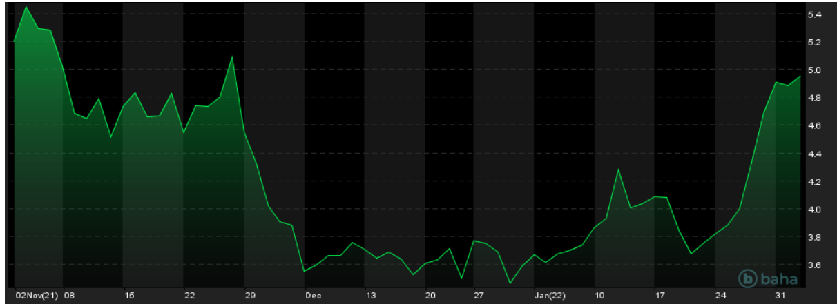
NYMEX, Natural Gas (LNG) marzec 2022, 3M

dyplomatyczne rozmowy odnośnie tego kryzysu na linii Biały Dom-Kreml, choć nie ma w nich przetomu.