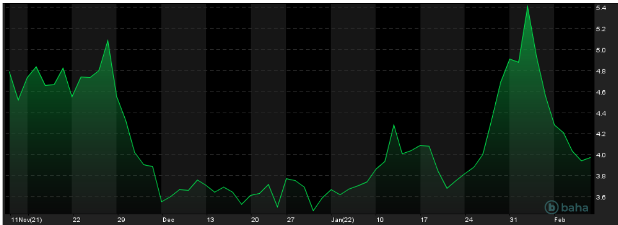
Natural Gas (LNG), marzec, NYMEX, 3M, źródło: baha.com

Ogromne zainteresowanie amerykańskim płynnym gazem ziemnym w Europie odbiło się na jego cenach w ostatnich tygodniach. Notowania kontraktów terminowych na nowojorskiej giełdzie NYMEX 2 lutego zamknęły się na poziomie 5,50$ za MMBtu (milion metrycznych brytyjskich jednostek ciepła), co oznaczało wzrost o ponad 50% od początku roku. Jednak ostatnie sześć sesji stało pod znakiem mocnych spadków. Notowania gazu ziemnego straciły w tym okresie 28%.