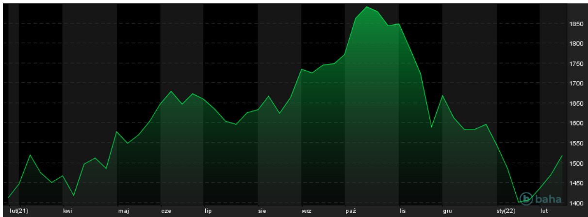
Notowania RTS Index, 1 Year

Początek tygodnia cechował się dużą zmiennością wśród indeksów. Napływające informacje dotyczące eskalacji konfliktu między Ukrainą i Rosją są niejednoznaczne. Weekendowe rozmowy na linii USA-Rosja okazały się bezowocne. Poniedziałkowa sesja przyniosła przeceny, szczególnie odczuwalne na rynkach europejskich. WIG20 w czasie sesji stracił 1,88%, niemiecki DAX 2,02%, a rosyjski RTS 2,99%. Dla moskiewskiej giełdy była to kontynuacja gwałtownej wyprzedaży aktywów. Indeks RTS już w piątek zniżył prawie 5%.