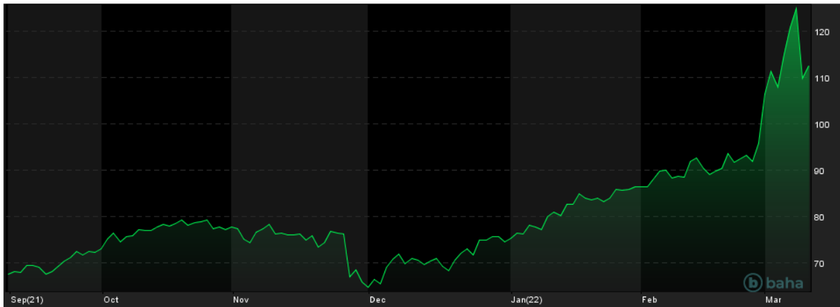
Notowania cen ropy WTI, 6M

W tej sytuacji, oczy inwestorów na rynku ropy naftowej zwrócone są na OPEC, ponieważ wiele krajów kartelu ma techniczne możliwości, aby zwiększyć produkcję ropy naftowej. Pojawiły się informacje o tym, że ambasador Zjednoczonych Emiratów Arabskich w USA wezwał kraje OPEC do wzmożonego wydobycia w celu uzupełnienia ewentualnej obniżonej podaży ropy naftowej z Rosji. Chociaż późniejsze wypowiedzi przedstawicieli kartelu nie były już tak zdecydowane, to sama możliwość bardziej zdecydowanego podwyższenia produkcji ropy w OPEC rozpalila wyobraźnię inwestorów i doprowadziła do spadku cen ropy naftowej w środę aż o 12-13%.