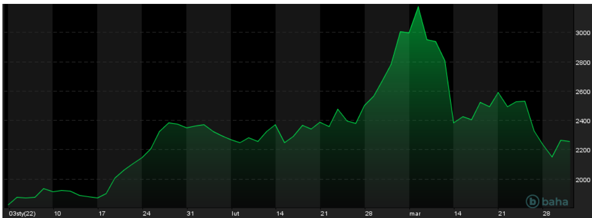
Notowania cen Palladu, YTD

Powrót obaw przyczynił się do odbicia notowań kontraktów na złoto oraz srebro. Dodatkowo, w górę odbiły się notowania platyny oraz palladu, czyli metali, których Rosja jest jednym z czołowych producentów. Tutaj również powróciły obawy o utrzymywanie się niepewności związanej z podażą metali, zwłaszcza palladu, w przypadku którego Rosja odpowiada za ponad jedną trzecią światowego wydobycia.