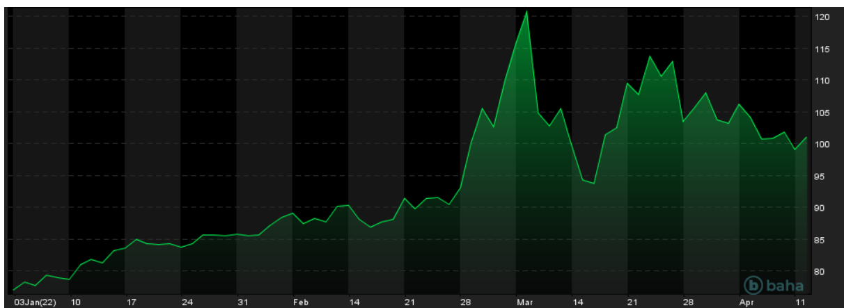
Notowania cen ropy Brent, YTD, źródło: baha.com

Wiele krajów UE posiada zasoby surowców energetycznych, pozwalające na funkcjonowanie przez kilka miesięcy. To stwarza bufor bezpieczeństwa, ale jednocześnie konieczność używania tych rezerw sprawiłaby, że zapasy ropy naftowej i gazu ziemnego w UE znalazłyby się na niepokojąco niskich poziomach. W konsekwencji, ceny surowców energetycznych miałyby impuls do znaczących wzrostów.