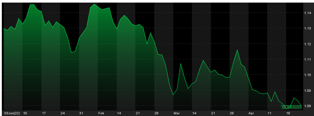
Notowania EUR/USD, YTD

Czwartkowa sesja nie przyniosła większej zmienności na rynku walutowym. Kurs EUR/PLN zniżył się o 0,03% kończąc dzień powyżej 4,63, a USD/PLN zwyżkował o 0,07% zamykając sesję na poziomie 4,28. Podczas czwartkowego przedpołudnia wiceprezes EBC Luis De Guinos opowiedział się za możliwością podwyżki stóp procentowych w strefie euro już w lipcu, tym samym dołączając do grona jastrzębi w radzie EBC. Chwilowo wpłynęło to na umocnienie euro i przebicie poziomu 1,09 przez EUR/USD, jednakże ta para walutowa zakończyła sesję kursem 1,083, co było dziennym spadkiem o 0,10%. Wypowiedź De Guinosa może sugerować sprzeczność pomiędzy wypowiedziami poszczególnych członków rady, a zdaniem Christine Lagarde, która w zeszłym tygodniu ostudziła oczekiwania inwestorów związane z podwyżką stóp procentowych. Zmiana narracji EBC może być skorelowana ze stanowiskiem Fed, którego prezes potwierdził plany podniesienia stóp procentowych w USA o 50pb. już w maju.