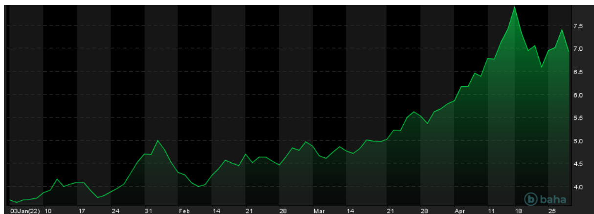
Notowania cen gazu, YTD

Skutki z ww. decyzją Rosji można już wyraźnie dostrzec na rynku gazu i ropy. Cena gazu wtorkowego popołudnia wynosiła 6.68$/MMBtu, kiedy to trafiły do mediów pierwsze nieoficjalne informacje o zakręceniu gazu przez Rosję do Polski. Podczas czwartkowej sesji notowania wzrosły do 7.40$/MMBtu, osiągając pokaźny wzrost o niemal 11%. Obecnie cena nieco się ustabilizowała, jednakże w dalszym ciągu oscyluje wokół 7.10$/MMBtu.