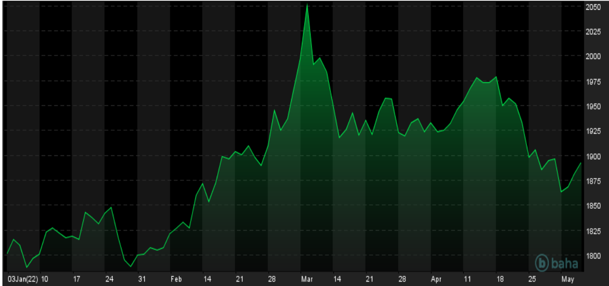
Notowania cen złota, YTD, źródło: baha.com