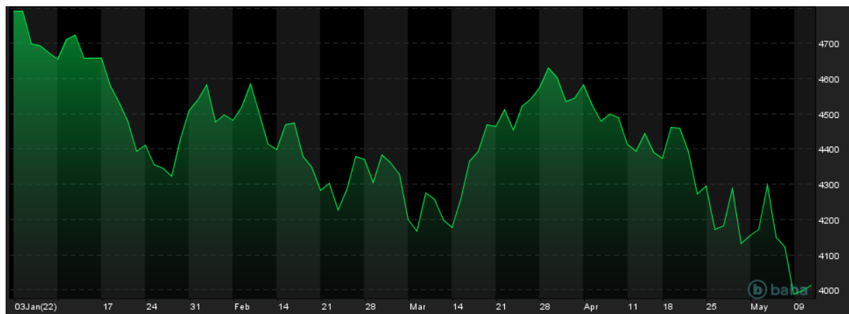
Notowania indeksu S&P500, YTD

38% postcovidowej fali hossy - jest to około 18-19% od szczytu notowań. W 2008 roku w tym miejscu została wygenerowana korekta wzrostowa wynosząca około 15%. Zaznaczyć trzeba, że warunki makroekonomiczne były diametralnie inne. Inflacja wynosi obecnie 8,5% versus 4,7% w 2008 roku, a indeksem ciąży wojna na Ukrainie, lockdowny w Chinach czy mocno jastrzębia polityka FED-u. Jednak te wszystkie negatywne czynniki mogą być już w cenach. Dziś poznamy dane o inflacji w USA i jeśli będą one poniżej konsensusu (8,1%) to, będzie to trigger do korekty wzrostowej, gdyż osłabi presję na obranie przez FED mocno jastrzębiej ścieżki.