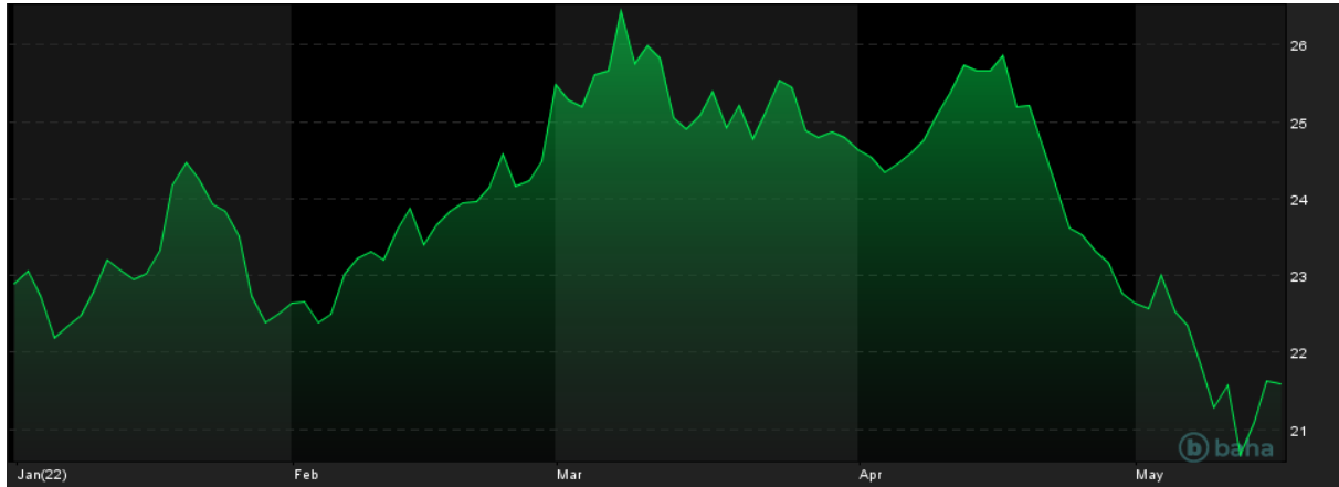
Notowania cen srebra, YTD

W przypadku obu kruszców, zarówno wcześniejsza seria niżek, jak i obecne odbicie notowań w górę, są powiązane z wpływem amerykańskiego dolara na wyceny tych metali. Dolar zyskiwał na wartości w ostatnich tygodniach, docierając do najwyższych poziomów od około dwóch dekad i wywierając presję na ceny wielu surowców, z metalami szlachetnymi na czele. Jednak obecnie wzrost wartości dolara wyhamował, co stworzyło pole do odbicia w górę notowań złota i srebra.