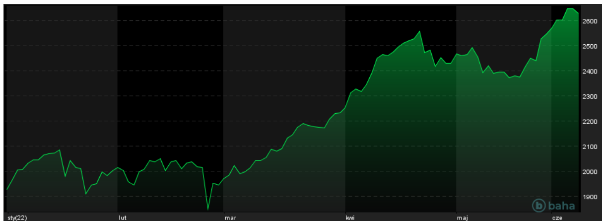
Notowania XU100, YTD, źródło: baha.com

Wtorkowa sesja giełdowa przebiegała stosunkowo spokojnie, a niezdecydowanie wśród inwestorów uwidoczniły rozbieżne wyniki giełd starego kontynentu i Wall Street. Główne indeksy zachodnioeuropejskie, czyli DAX i CAC40 zdyskontowały poniedziałkowe wzrosty, odpowiednio zniżkując 0,66% i 0,74%. Na warszawskim parkiecie widoczny był jeszcze większy brak entuzjazmu wśród inwestorów, a WIG20 tracił 1,13%. Za oceanem można było zauważyć odmienny sentyment, a indeksy NASDAQ 100 i S&P 500, pomimo zróżnicowanych komponentów wyżkowały odpowiednio 0,94% i 0,95%. Wśród indeksów bardziej egzotycznych krajów można zwrócić uwagę na turecki indeks XU100, który wyznaczył nowe historyczne szczyty, oraz portugalski PSI20, który wrócił do poziomu ostatnio widzianego w 2014 roku.