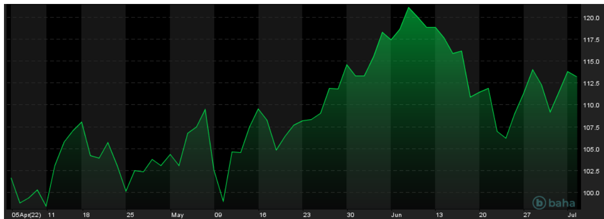
Notowania cen ropy Brent, 3M

W ostatnich tygodniach notowania ropy naftowej poruszały się nerwowo w ruchu bocznym. Cena tego surowca w ostatnim czasie wciąż powraca ponad poziom 110 USD za baryłkę, co świadczy o nieustającej sile strony popytowej, wynikającej z obaw o zaburzenia produkcji i handlu ropą naftową, a zwłaszcza o podaż w Europie. Jednak wzrosty cen ropy naftowej są ograniczane przez obawy o globalną recesję, która obecnie w wielu krajach jest już prawie pewnym scenariuszem.