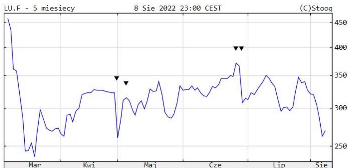
Notowania cen węgla, 5M, źródło: stooq.pl

Na początku bieżącego tygodnia na rynkach surowcowych uwagę inwestorów zwróciły dane dotyczące handlu zagranicznego Chin. Pojawiły się one już w niedzielę, ale właśnie w poniedziałek miały największy wpływ na ceny. Nie był to jednak wpływ jednoznaczny, ponieważ o ile informacje dotyczące handlu zagranicznego ogółem zostały odczytane jako dobre, to same dane dotyczące importu surowców miały już mieszany wydźwięk.