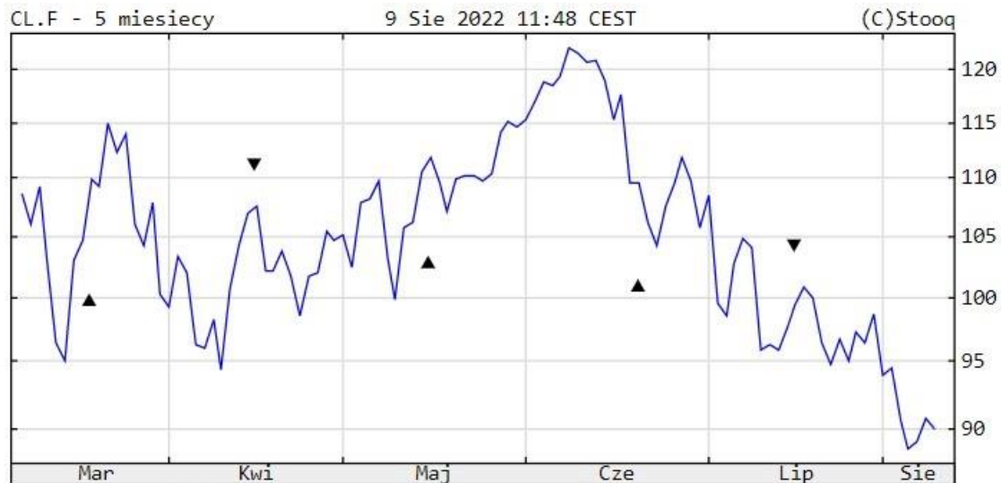
Notowania cen ropy WTI, 5M

towarów. Warto jednak zaznaczyć, że zwyżkę tę uznaje się za tymczasową i jest duże prawdopodobieństwo, że w kolejnych miesiącach już się ona nie powtórzy.