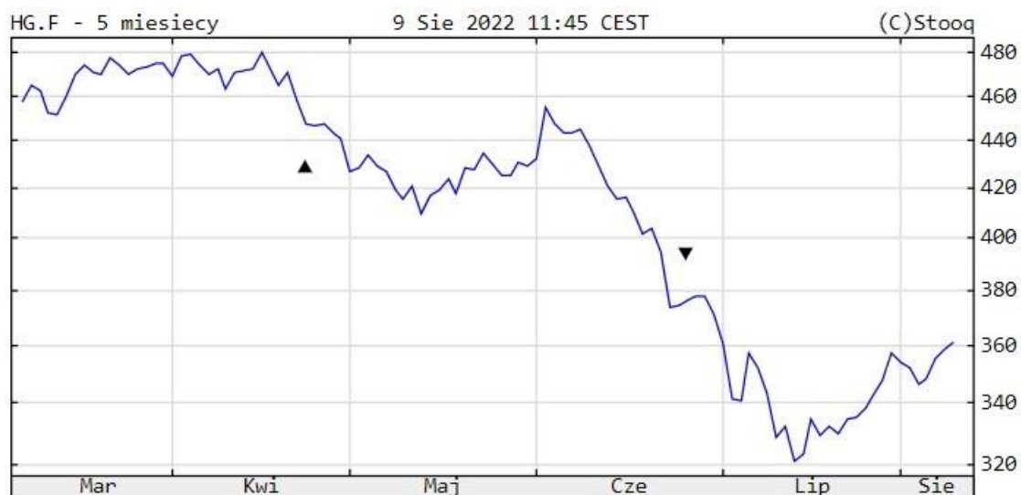
Notowania cen miedzi, 5M, źródło: stooq.pl

Z kolei największym rozczarowaniem były dane dotyczące lipcowego importu ropy naftowej do Chin. W poprzednim miesiącu wyniósł on zaledwie 8,79 mln baryłek dziennie. To co prawda delikatna zwyżka w stosunku do czerwca (kiedy znalazł się na poziomie 8,2 mln baryłek dziennie), jednak ogólnie oba wspomniane miesiące notowały najmniejszy import ropy naftowej na przestrzeni ostatnich 4 lat.