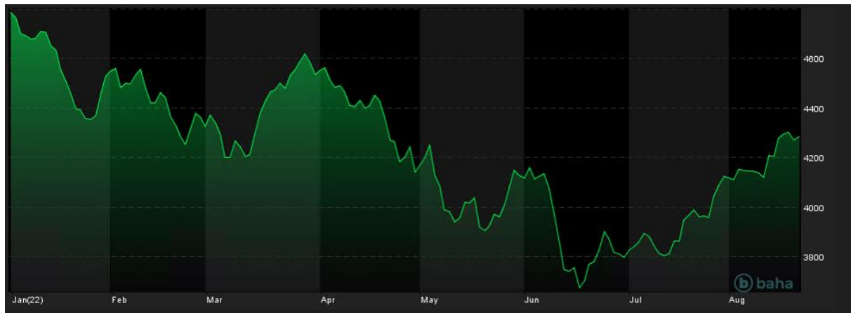
Notowania indeksu S&P 500, YTD

to wszystko w perspektywie prawdopodobnego kryzysu energetycznego, który najmocniej odczuje Europa. Co prawda Stany Zjednoczone nie są aż tak narażone na braki energii, jednakże ceny surowców energetycznych na światowych rynkach wpłyną na niemal każdą gospodarkę.