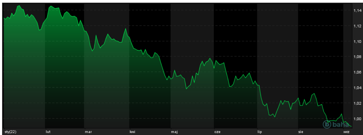
Notowania EUR/USD, YTD

Wtorkowa sesja nie przyniosła większej zmienności na rynku walutowym. Kurs EUR/PLN zwyżkował o 0,23%, kończąc dzień w pobliżu poziomu 4,73, a USD/PLN zwyżkował o 0,49% zamykając sesję w okolicach 4,77. Para walutowa EUR/USD pogłębiła 20-letnie minima. W trakcie sesji ta najpopularniejsza para była kwotowana poniżej 0,986. Jest to trzeci tydzień, kiedy cena zamknięcia EUR/USD znajduje się poniżej parytetu, czasami podczas sesji przebijając poziom 1,00, który z technicznego punktu widzenia może stać się linią oporu popytu tej pary walutowej.