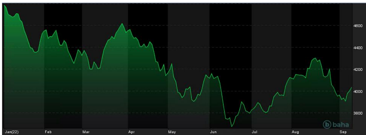
Notowania cen S&P500, YTD

Głównym wydarzeniem tygodnia wydaje się jednak decyzja Europejskiego Banku Centralnego odnośnie do podwyżki stóp procentowych o 75 pb. Władze EBC w komunikacie starły się przekazać, jak stanowczo zamierzają działać, by „zdecydowanie zbyt wysoka” inflacja wkrótce powróciła do docelowego poziomu (2% w średnim okresie). Pytanie, na jak duże podwyżki pozwolić może sobie Christine Lagarde w kontekście zadłużenia i rentowności obligacji takich krajów, jak chociażby Włochy czy Grecja. Zapewne na niewielkie. Notowania indeksu Dax na zakończenie czwartkowej sesji pokazały spadek o 0.09%.