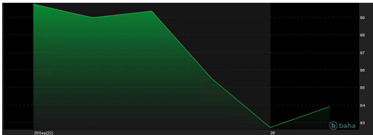
Notowania cen ropy Brent, 1w

Po dużej zmienności i spadku do 9-miesięcznych dotków w poniedziałek, we wtorkowy poranek notowania ropy naftowej nieśmiało odrabiają straty. Kontrakty na brent na londyńskiej giełdzie paliw ICE Futures Europe wyceniane są po 84,00 dolarów za barytkę, z kolei notowane na giełdzie paliw NYMEX kontrakty na barytkę ropy West Texas Intermediate kosztują 77,90 dolarów za barytkę.