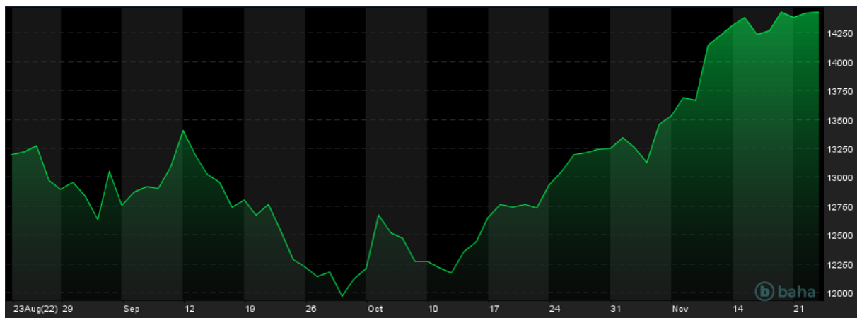
Notowania Dax, 3M, źródło: baha.com