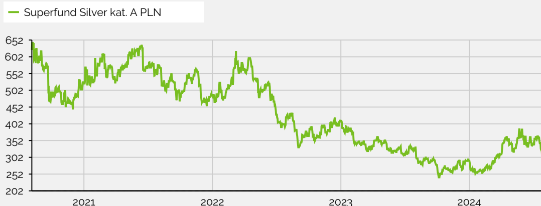
Wykres notowań od: 2020-08-06 do: 2024-07-31.