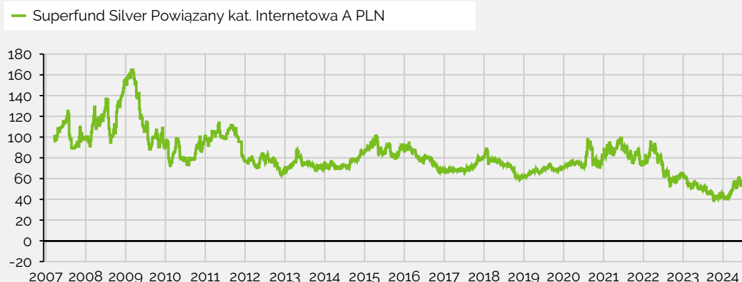
Wykres notowań od: 2006-12-11 do: 2024-07-31.