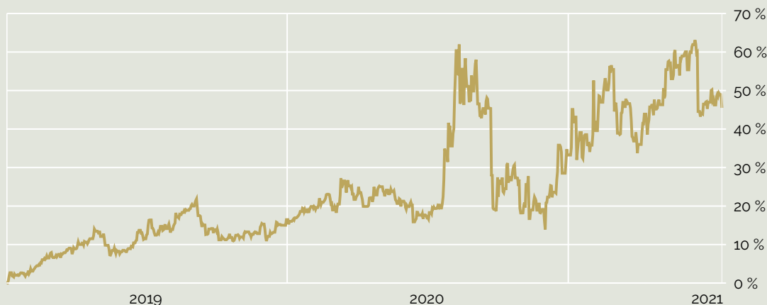
— Superfund Silver Powiązany kat. Standardowa PLN