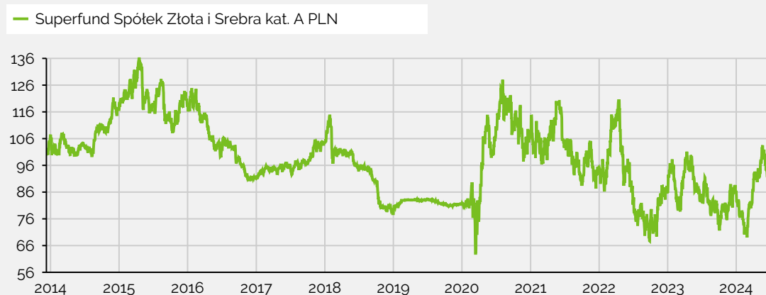
Wykres notowań od: 2013-12-10 do: 2024-06-30.