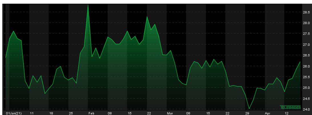
Notowania cen srebra, YTD, źródło: Teletrader.com

SUPERFUND TFI S.A., INFOLINIA: +48 22 556 88 62, WWW.SUPERFUND.PL